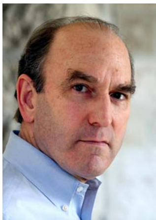
Elliott Abrams Miembro del Council on Foreign Relations, experto en Oriente Medio

Nació en 1948 y se educó en Harvard y en la London School of Economics. Actualmente es miembro del Council on Foreign Relations, especializado en Oriente Medio.