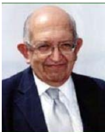
Plinio Apuleyo Mendoza Escritor y periodista

Nació en Colombia en 1932. Estudió Ciencias Políticas en el Institut des Sciences Politiques de París y en la actualidad trabaja como escritor y periodista.