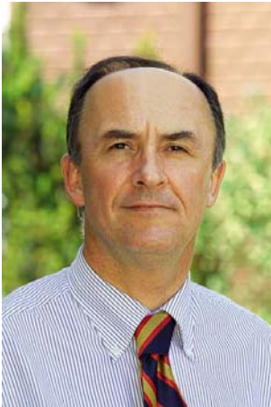
Cristián Larroulet Director del Centro de Estudios Libertad y Desarrollo

Cristián Larroulet Vignau es ingeniero Comercial de la Pontificia Universidad Católica de Chile y máster of Arts en Economía de la Universidad de Chicago. Actualmente es director ejecutivo del Centro de Estudios Libertad y Desarrollo, decano de la Facultad de Economía y Negocio de la Universidad de Desarrollo y profesor de la misma universidad. Es miembro de The Mont Pelerin Society, miembro de número de la Academia Chilena de Ciencias Sociales, Políticas y Morales desde 2002, consejero fundador de Fundación Internacional para la Libertad (FIL), presidida por Mario Vargas Llosa, y consejero de la Fundación Miguel Kast.