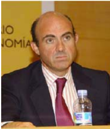
Luis de Guindos Socio responsable de Servicios Financieros Pricewaterhouse Coopers

Nació en Madrid en 1960. Es licenciado en Ciencias Económicas y Empresariales por CUNEF, y premio extraordinario fin de carrera por la Universidad Complutense de Madrid. Técnico comercial y economista del Estado, fue socio y consejero de AB, y presidente para España y Portugal de Lehman Brothers y de Nomura Securities. Actualmente es socio responsable de Servicios Financieros en Pricewaterhouse Coopers, y también ejerce como profesor del Instituto de Empresa.