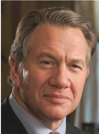
Michael Portillo Co-presidente de las Tertulias británico-españolas

Nació en Londres en 1953, hijo de un exiliado de la Guerra Civil española. Estudió en el colegio de Harrow County y posteriormente obtuvo el título de Historia en Peterhouse, Cambridge. Actualmente, entre otras ocupaciones, es el co-presidente de las Tertulias británico-españolas.