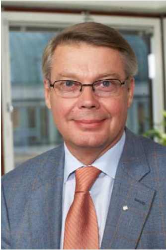
Bo Lundgren Director General de la Oficina Sueca del Tesoro

Bo Lundgren fue miembro del Parlamento sueco desde 1976 hasta 2004, y ministro de Asuntos Financieros y Fiscales desde 1991 hasta 1994. Como tal, fue responsable de conducir la profunda crisis del sector financiero sueco después de la burbuja especulativa de finales de los 80. Fue también responsable de las reformas impositivas que se llevaron a cabo, entre ellas la supresión del impuesto sobre los ingresos provenientes del comercio de valores, el patrimonio y la doble imposición sobre dividendos y ganancias de capital.