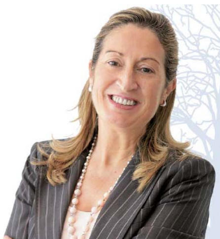
Ana Pastor Julián Vicepresidenta segunda de la Mesa del Congreso

Nacida el 11 de noviembre de 1957 en Cubillos, Zamora, es licenciada en Medicina y Cirugía por la Universidad de Salamanca y médico especialista en medicina familiar y comunitaria. Además, es funcionaria del Cuerpo Superior de Salud Pública y Administración Sanitaria y posee un máster en dirección de empresas, en salud pública, administración sanitaria y gestión hospitalaria.