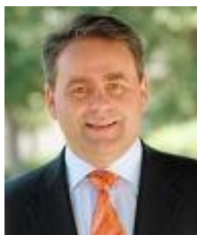
Xavier Bertrand Diputado del Parlamento Nacional Francés Secretario General de la UMP

Nació el 21 de marzo de 1965 en Châlons-sur-Marne (Francia). Tiene un Máster en Derecho Público y Diploma de Estudios Superiores Especializados (DESS) de la Administración Local. Es diputado de Parlamento Nacional Francés por el departamento de Aisne desde 2002 y Secretario General de la UMP desde su elección, el 24 de enero de 2009.