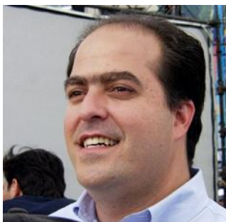
Julio Andrés Borges Junyent Presidente de 'Primero Justicia'

Nació en Caracas el 22 de octubre de 1969. Abogado licenciado de la Universidad Católica Andrés Bello en 1992. Consiguió la maestría en Filosofía Política y Social en el Boston College de Estados Unidos en 1994, además de otra maestría en Políticas Públicas y estudios de América Latina en la Universidad de Oxford, en 1996.