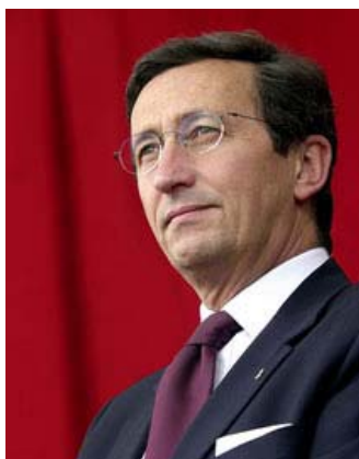
Gianfranco Fini Presidente de la Cámara de Diputados de Italia