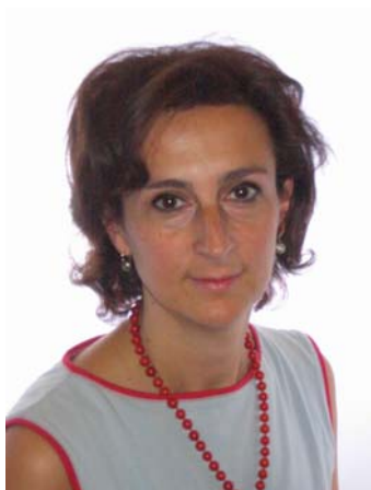
Marta Cartabia Catedrática de Derecho Constitucional

Nacida en Italia, Marta Cartabia es profesora de Derecho Público y Derecho de la Unión Europea en la Universidad de Verona, y también catedrática de Derecho Constitucional en la Universidad de Milano-Bicocca. Obtuvo un doctorado en Derecho en el Instituto Universitario Europeo de Florencia en 1992.