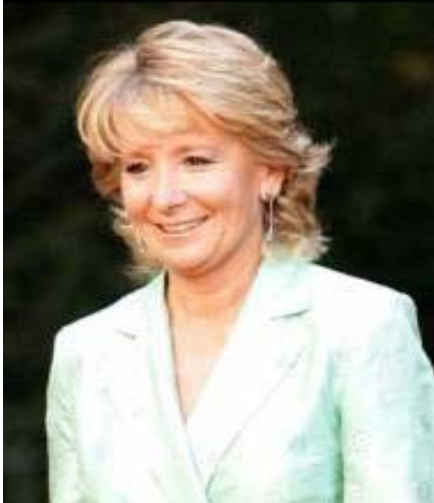
Esperanza Aguirre Presidenta de la Comunidad de Madrid

Nacida en Madrid el 3 de enero de 1952, está casada y tiene dos hijos. Es Licenciada en Derecho, presidenta del PP de Madrid y presidenta de la Comunidad de Madrid.